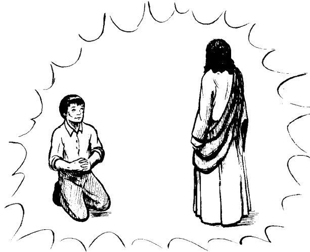
TRANSFORMADO A SU IMAGEN

18 El propósito de la santificación consiste en